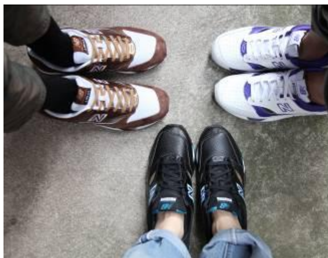
(左)M150BR (中)M150BBT (右)M150GN